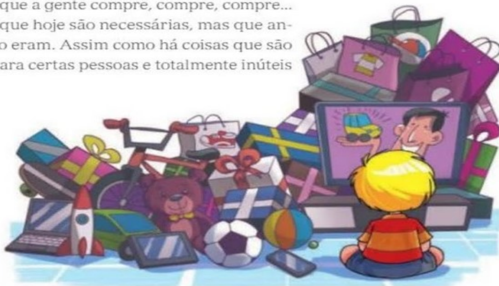
CABRAL, Graciela Beatriz. Livros do tatu . São Paulo: Garimpo Cultural, 1990.

Há coisas que hoje são necessárias, mas que antigamente não eram. Assim como há coisas que são necessárias para certas pessoas e totalmente inúteis para outras.