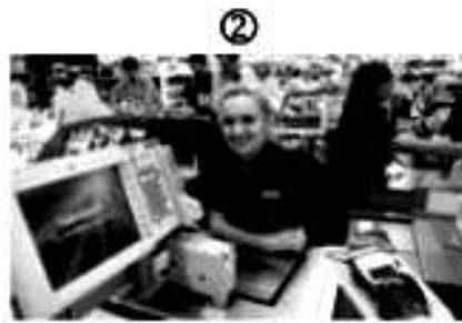
Atendente de caixa